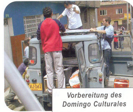
Vorbereitung des Domingo Culturales