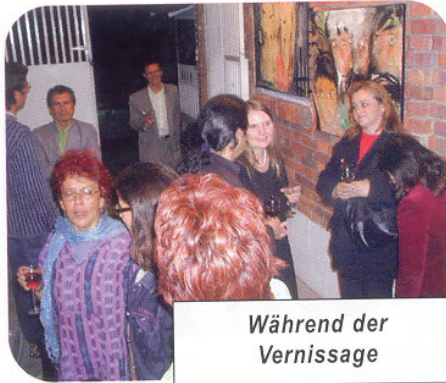
Während der Vernissage