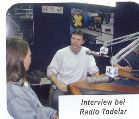
Interview bei Radio Todelar