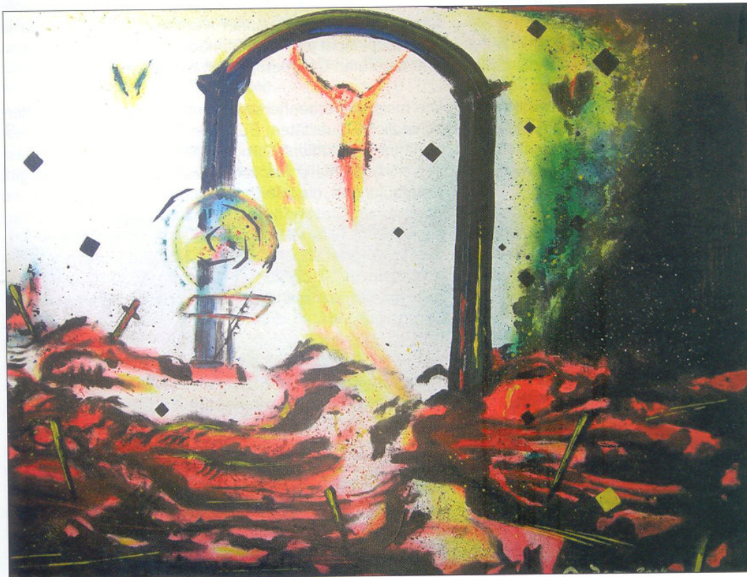
Uwe Anders Los Cuerpos

Inzwischen konnte ich ein weiteres dort verbliebenes Bild verkaufen, so daß sämtliche Kosten gedeckt wurden und sich ein Plus auf der Habenseite ergaben. Alles in Allem war es ein unvergeßliches Erlebnis, daß ich auf keinen Fall missen möchte. Noch heute trage ich das Armbändchen mit den typischen kolumbianischen Farben.